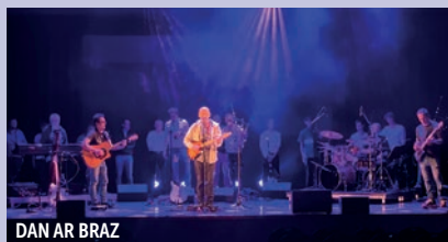
DAN AR BRAZ