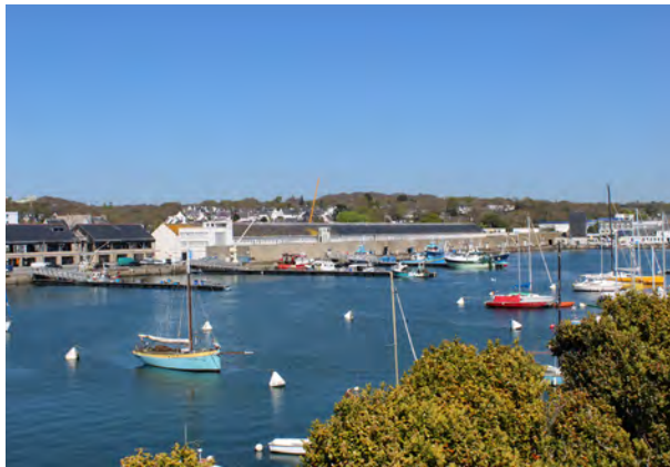
Le port de pêche