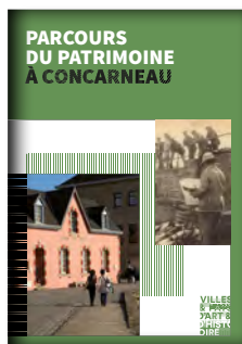
Parcours du Patrimoine à Concarneau Disponible à la Maison du Patrimoine et au Bureau d'Information Touristique

La presqu'île, là où au début du 20 e siècle ne s'étendaient que des champs et des landes parsemées de rochers, est aujourd'hui un quartier résidentiel plein de charme, avec ses villas nichées dans les pins et ses petites criques de sable.