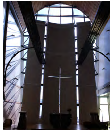
L'autel et le chœur de l'église Saint-Guénoël, hors de la Ville-Close