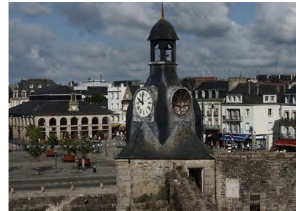
Les halles de Joseph Bigot © Bernard GALERON