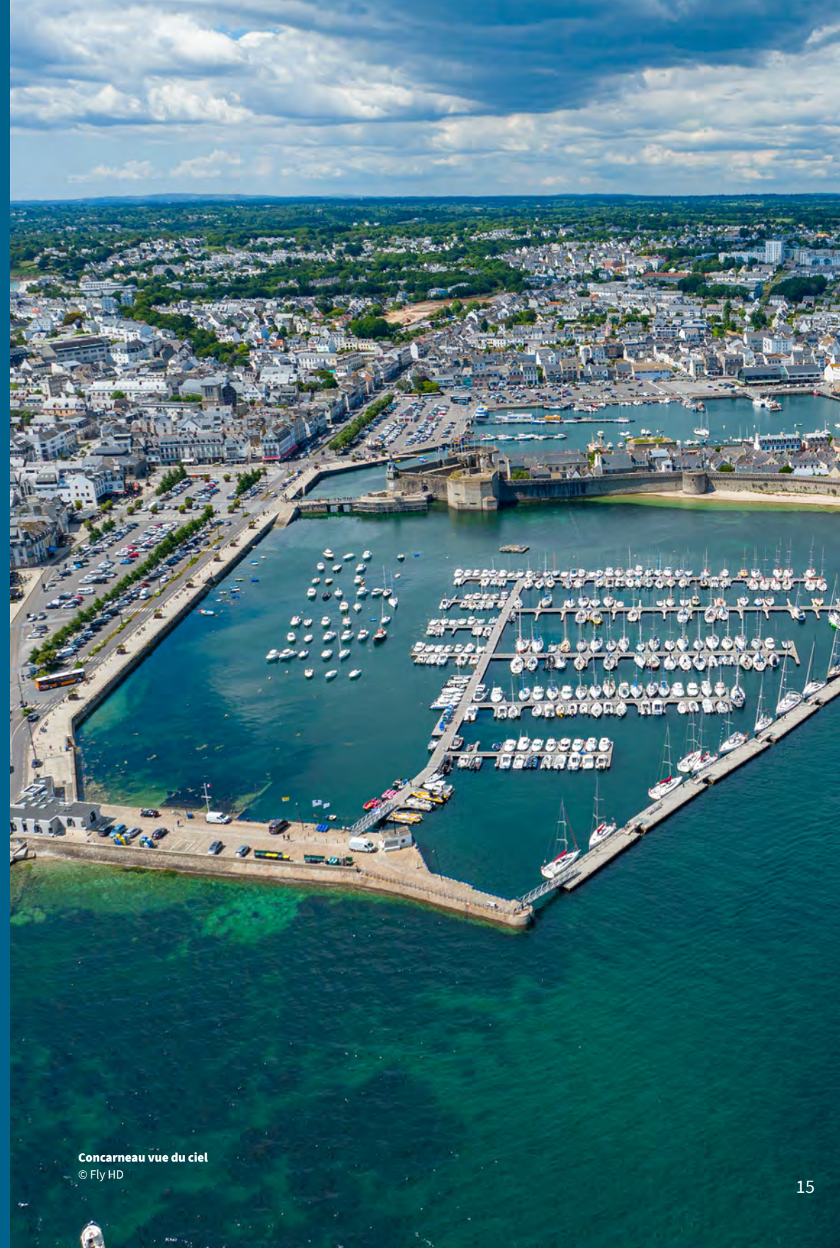
Concarneau vue du ciel