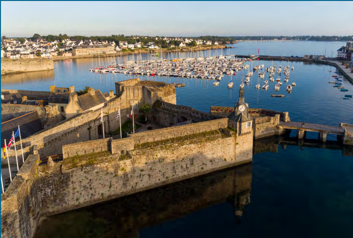
L'entrée Ouest de la Ville-Close.

In Thierry RIBOUCHON, Les fortifications de Concarneau , 2005