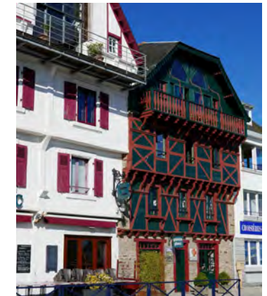
La maison en bois